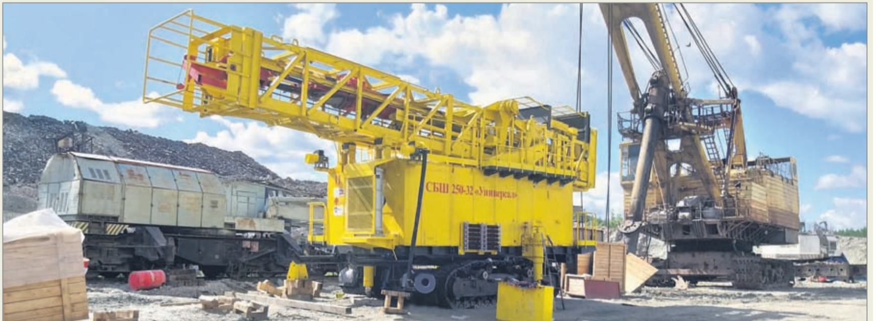
На Коршунковском карьере скоро пойдёт в работу новая буровая установка СБШ-250-32 «Универсал»

Руководят монтажом бурстанка специалисты сер-