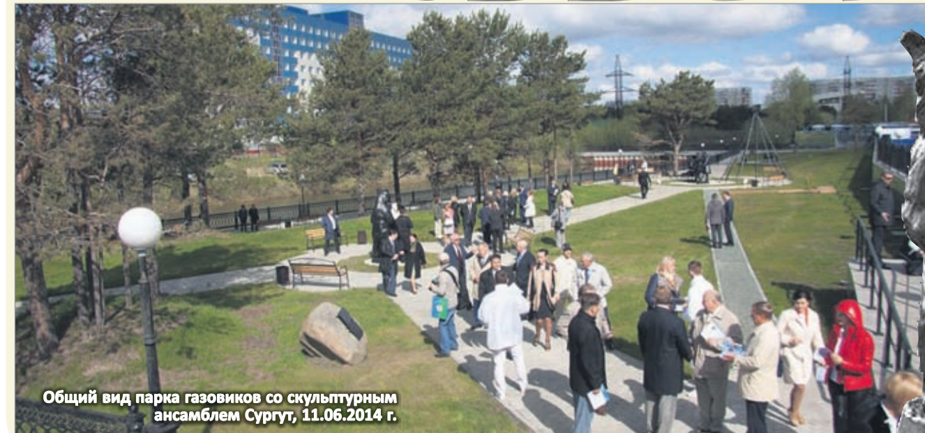
Общий вид парка газовиков со скульптурным ансамблем Сургут, 11.06.2014 г.