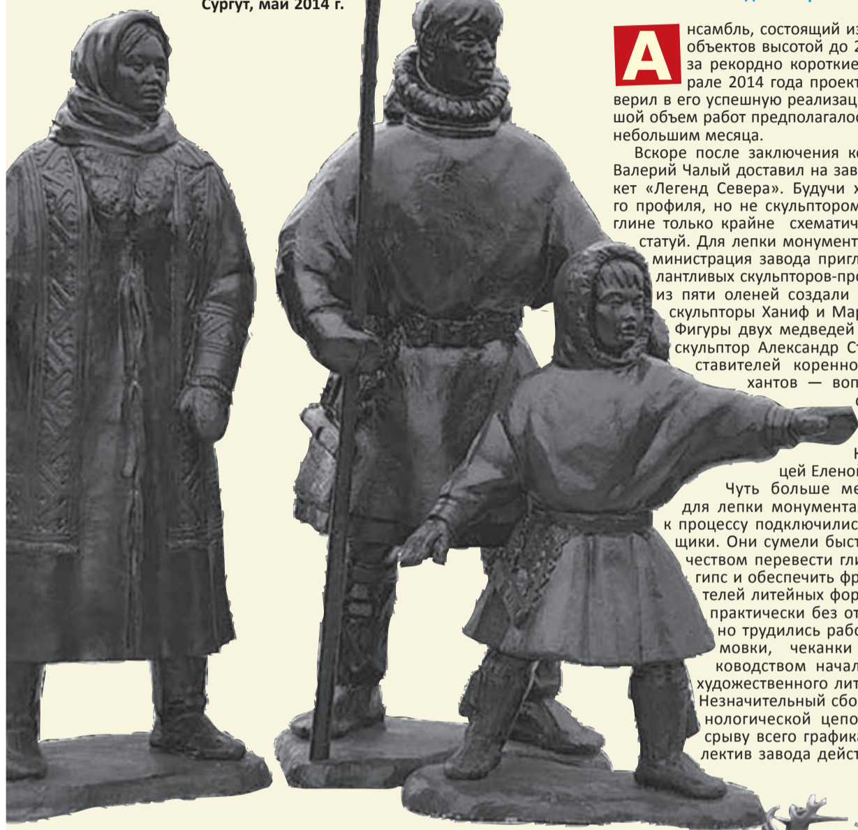
На переднем плане — скульптурная группа «Семья оленеводов». Сургут, май 2014 г.

Славная история Каслинского завода архитектурно-художественного литья пополнилась очередной яркой страницей: 11 июня 2014 года в Сургуте был открыт созданный каслинцами по заказу ООО «Газпром трансгаз Сургут» масштабный скульптурный ансамбль «Легенды Севера».